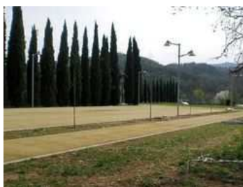
Il parcheggio sistemato a fianco del cimitero di Magrè. A.L.